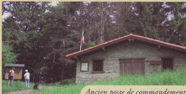
Ancien poste de commandement du Maquis

2. S'engager à droite sur le parcours historique. Suivre le sentier qui franchit le ruisseau naissant, virer à gauche et remonter la rive du talweg. Des rambardes de sécurité invitent à la prudence, notamment si le terrain est glissant. Les hêtraies-sapinières de Picaussel abritent également d'autres variétés, numérotées en bord de circuit : pins sylvestres, épicéas, merisiers, chênes pubescents, saules, bouleaux, tilleuls, frênes, noyers.