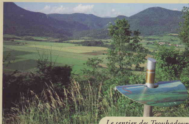
Le sentier des Troubadours